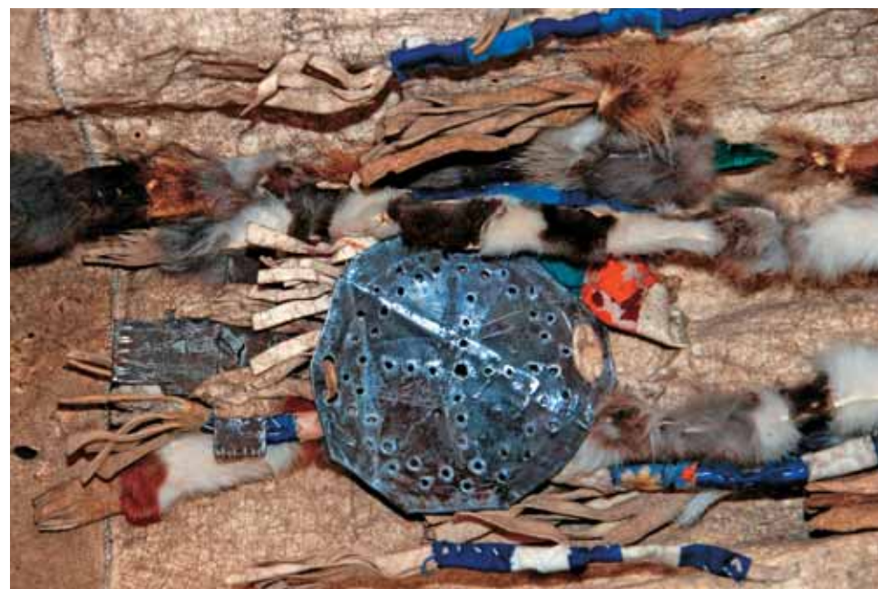
Соляной диск и деревянная кукла эмэгэт – принадлежности шаманского костюма. Солнце освещало шаманке путь во время ее путешествия по сумрачному Нижнему миру, с помощью куклы она общалась с духами и остальными обитателями потустороннего мира. Краеведческий музей с. Хонуу Момского улуса Якутии

Обычно эвены сжигают одежду и личные вещи умершего, считая, что после погребения от него не должно оставаться никаких следов. Однако в данном захоронении имущество шамана осталось в целости. Возможно, это особенность момского погребального обряда.