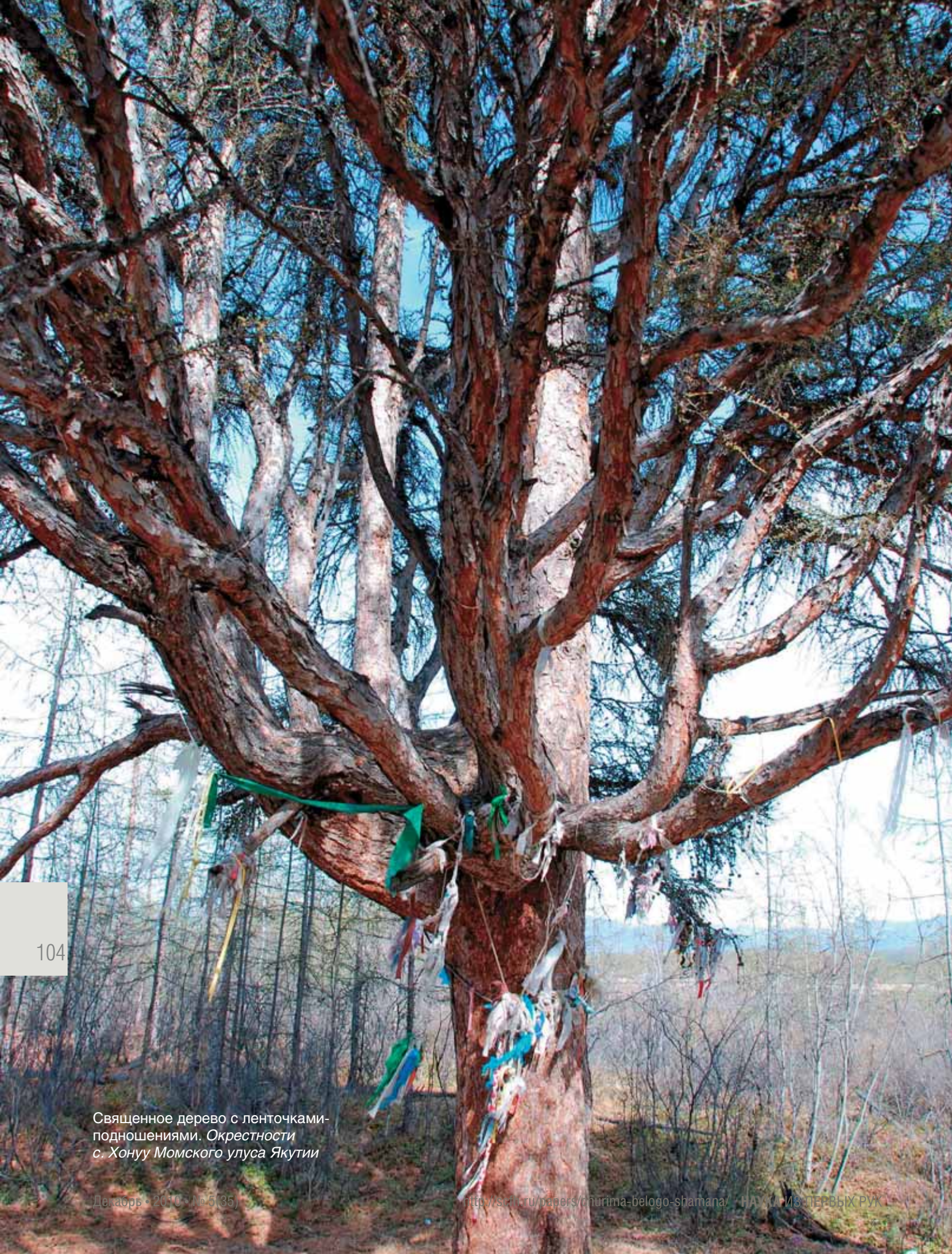
Священное дерево с ленточками-подношениями. Окрестности с. Хонуу Момского улуса Якутии