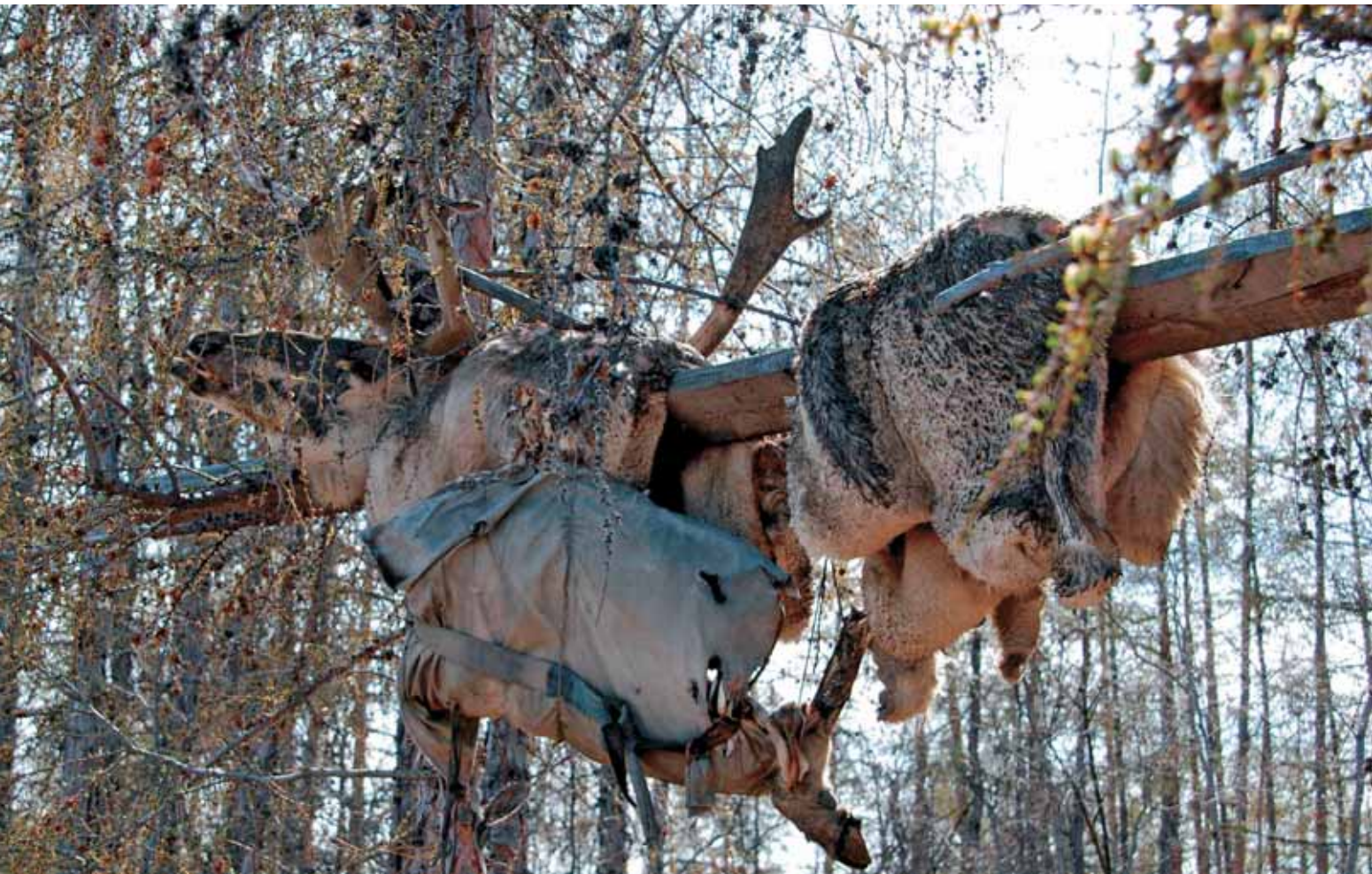
Останки жертвенного оленя, седло и вещи покойного эвена на кладбище с. Хонуу Момского улуса Якутии