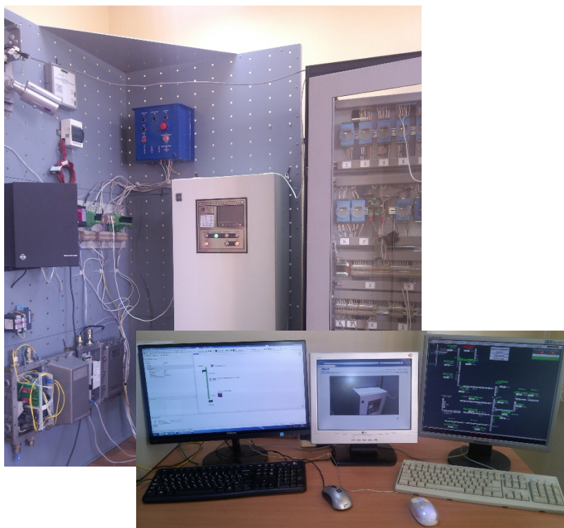
Рис. 1. Внешний вид имитационного программно-аппаратного комплекса

Комплекс имеет двухуровневую структуру, содержащую программный и аппаратный уровни. Внешний вид комплекса изображен на рис. 1. Программный уровень содержит: SCADA (от англ. Supervisory Control And Data Acquisition – диспетчерское управление и сбор данных) систему БЛАКАРТ [19], среду имитационного моделирования MTSS [20], менеджер связи, модели технологических процессов, модели технологического оборудования, программы управления АСУ ТП.