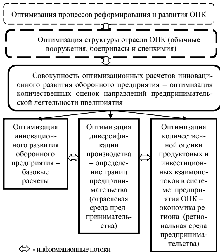
Рис. 2. Общая схема оптимизационных расчетов в системе взаимодействия ОПК – отрасль – предприятие – регион

ленческой технологии исполнения оборонного заказа. Становится важным правильное представление места и роли оборонного предприятия в среде отрасли, к которой организационно относится данное предприятие и в среде региональных экономических отношений. В диссертации вышесказанное описывается с помощью совокупности экономико-математических задач на примере промышленности обычных вооружений, боеприпасов и спецхимии, к которой организационно относится наш объект исследования (ОАО «НИИЭП»). Основное назначение этой совокупности - получение количественных оценок возможностей предпринимательской деятельности в указанных конкурентных средах (рис. 2).