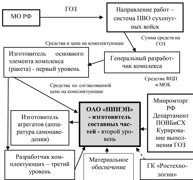
Рис. 3. ОАО «НИИЭП» в системе производственно-финансовых связей

Оценка направлений предпринимательской деятельности научно-производственного оборонного предприятия в отраслевой среде может быть осуществлена в результате решения экономико-математической задачи в вариантной постановке или задачи диверсификации производства.