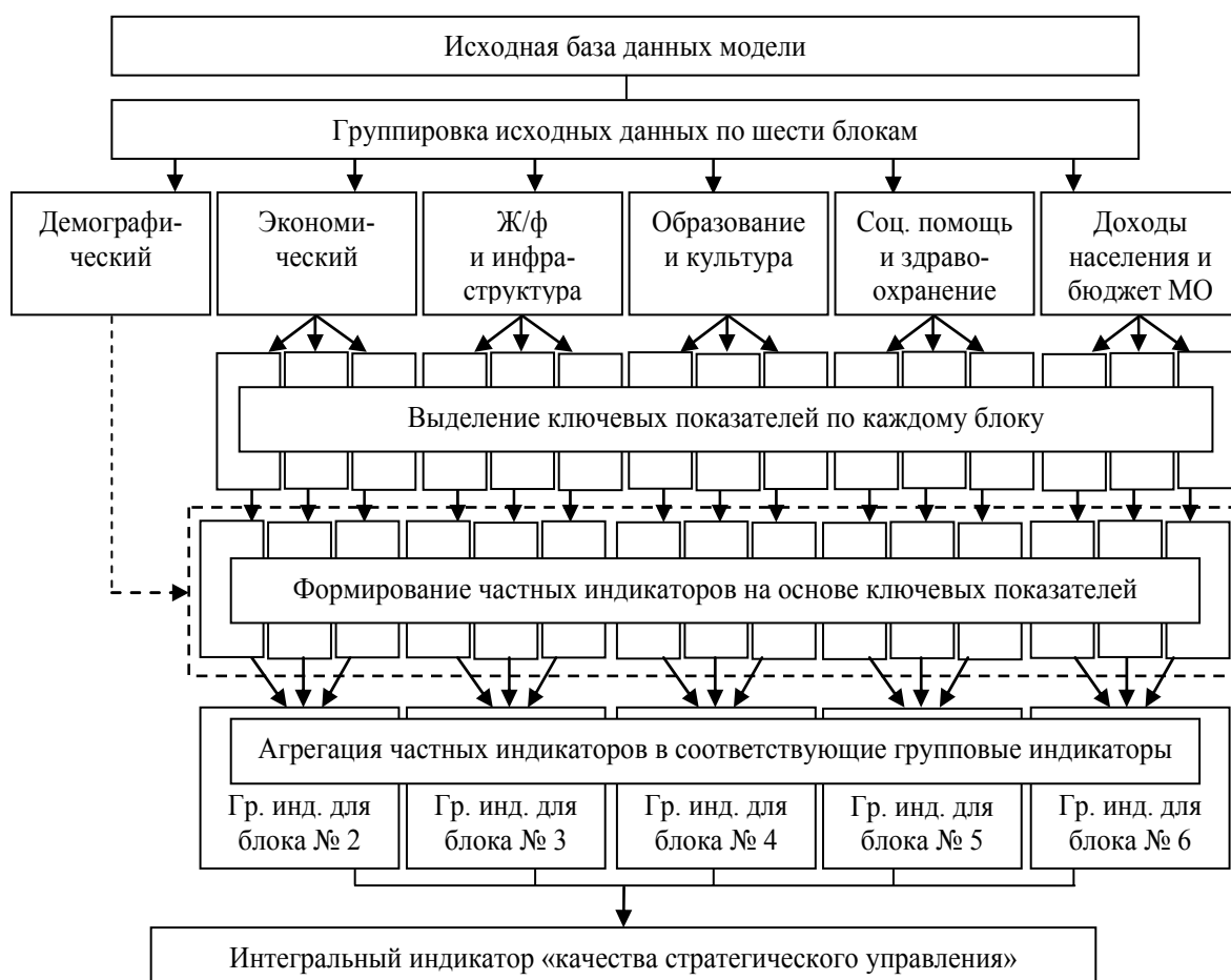
Рис. 2. Методика формирования интегрального индикатора

менение динамики в соответствующих секторах социально-экономической жизни МО. На основании групповых индикаторов рассчитывается итоговый показатель – интегральный индикатор «качества стратегического управления».