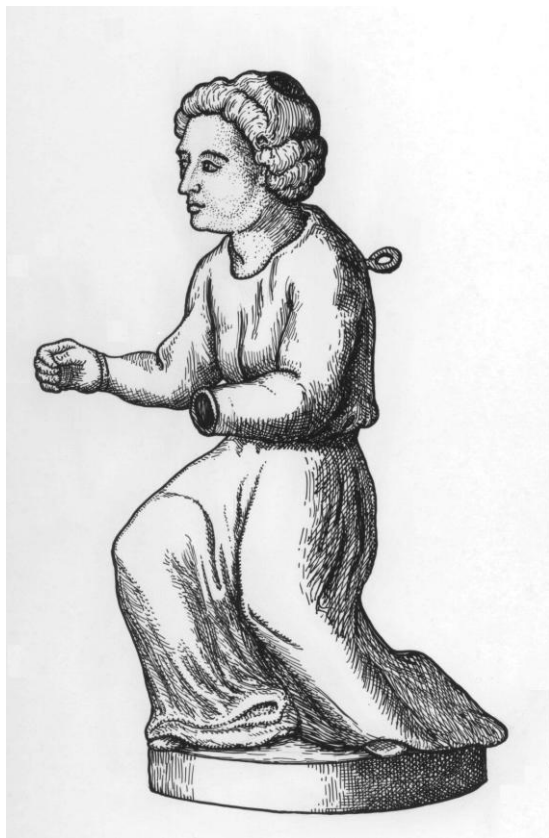
Рис. 3. Изображение бронзовой статуэтки человека в длиннополой одежде (по: [Montfaucon, 1724. P. 153. LXX, 2])

этой статуэтки из книги Б. Монфокона был репродуцирован в книге по мифологии и буддизму в Тибете и Монголии немецкого исследователя древностей Восточного Туркестана А. Грюнведеля [Grunwedel, 1900. Taf. 116].