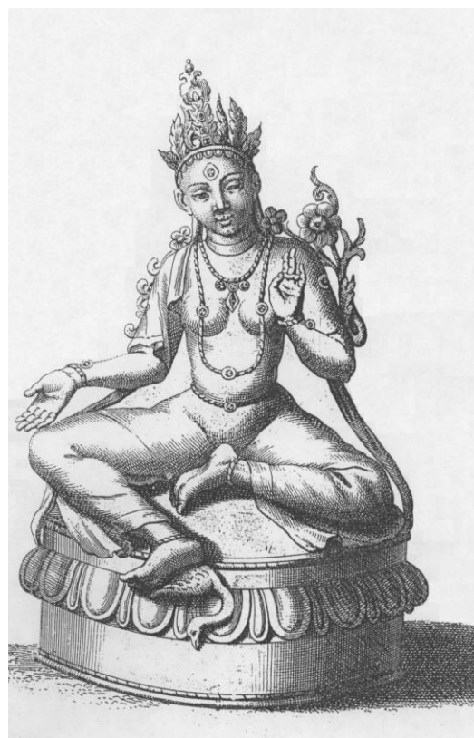
Рис. 2. Изображение бронзовой статуэтки буддийской богини Зеленая Тара из Аблайкитской коллекции (по: [Montfaucon, 1724. P. 153. LXX, 1])