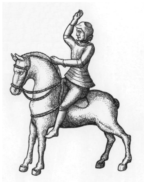
Рис. 4. Изображение бронзового акваманила – сосуда для омовения рук в виде конного рыцаря из Аблайкитской коллекции (по: [Montfaucon, 1724. P. 154. LXXI, 1])

рис. 2]. На этом рисунке некоторые детали отличаются от изображенных в труде Б. Монфокона. На голове всадника показан сферический шлем с бармицей, на плечах широкие оплечья, подол панциря спереди имеет разрез. Лошадь на этом рисунке показана более колоритно, с круто изогнутой плотной шеей, плотным коротким туловищем на коротких толстых ногах (рис. 5, 1). Произведение художника рисовальной палаты представляется более точным и выразительным, чем рисунок из труда Б. Монфокона, однако нет сомнения в том, что во всех основных деталях оба рисунка совпадают и изображают один и тот же оригинал из состава Аблайкитской коллекции. Это важно подчеркнуть, поскольку Т. К. Шафрановская в своей статье ошибочно указала, что на этом рисунке изображена бронзовая статуэтка всадника из Семипалатинска, «из коллекции Мессершмидта» [Шафрановская, 1965. С. 152, рис. 2]. В коллекции, собранной в Сибири Д. Г. Мессершмидтом, действительно имелся бронзовый акваманил, или водолей – сосуд для омовения рук в виде скульптуры конного рыцаря [Brentjes, Vasilievsky, 1989. S. 171]. Однако находка Д. Г. Мессершмидта в виде фигуры рыцаря имеет существенные отличия и гораздо более детализована, чем находка из Аблайкита. Рыцарь изображен в кольчужном