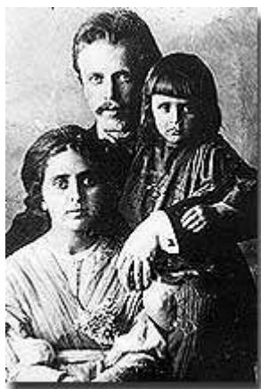
Фото 1908 г.

Тема диссертации Л. была связана с исследованием народного хозяйства как непрерывного процесса. В 1927-1928 гг., продолжая обучение в Берлинском университете, он начал свою профессиональную карьеру в качестве экономиста-исследователя Института мирового хозяйства в Кильском университете (Германия). В то время его интересовал анализ производной статистического спроса и кривой предложения. В 1928 г. в возрасте 22 лет он получил степень доктора наук по экономике. Его исследовательская работа была прервана, когда в 1929 г. он отправился в Нанкин (Китай) в качестве экономического советника министерства железных дорог в правительстве Китая. После возвращения в Германию Л. продолжил работу в Институте мирового хозяйства.