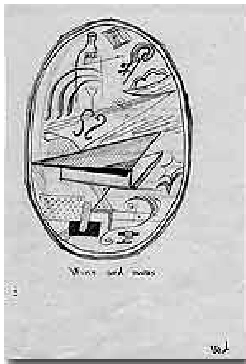
“Вино и музыка”