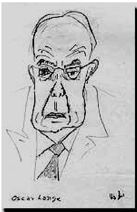
Польский экономист Оскар Ланге