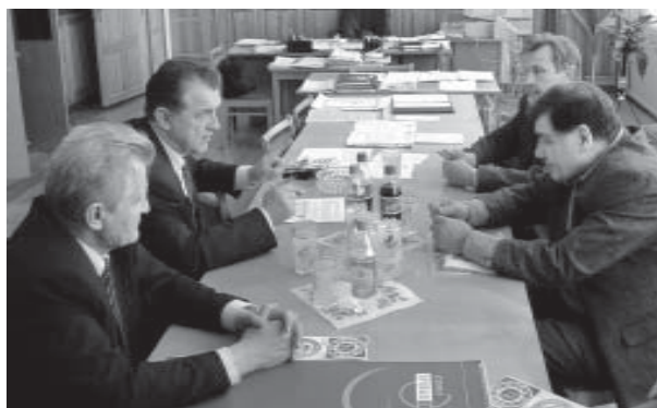
Подписание договора о сотрудничестве между НГУ и МФТИ

Не могу не напомнить о последнем выходном апреля, когда в Доме ученых прошли выступления нашего клуба КВАНТ, а в клубе «Черная кошка» состоялась совместная медиана физфака и факультета журналистики. То и другое события, безусловно, яв-