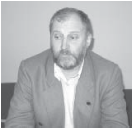
Владислав Шацкий, декан факультета, член-корреспондент РАН

«Дорогие друзья! Вот и наступил один из ответственных моментов в вашей жизни: вам необходимо определиться в выборе профессии. С этой точки зрения геолого-геофизический факультет для многих из вас является Terra Incognita. К сожалению, в школе отсутствуют предметы, дающие представления о том, чем занимается геология. Но вы имеете первоначальные представления о химии, физике, математике, биологии, что не в последнюю очередь определяет ваш выбор. В приведенной ниже информации вы сможете узнать о том, чему учат на ГГФ. Я надеюсь, это даст вам возможность осознать, что геология – огромное поле для реализации своих возможностей и что геолог – это не только человек с молотком, бродящий по тайге в поисках полезных ископаемых. В отличие от других наук, изучающих те или иные объекты окружающего мира, объектом исследования геологии в широком смысле является Земля и другие планеты Солнечной системы. Исследование такого объекта предполагает использование последних достижений естественных наук. Поэтому, поступив на ГГФ НГУ, вы сможете реализовать свой ин-